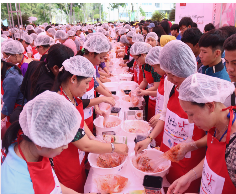
Viên chức và sinh viên Trường thực hành làm bánh kim chi.

Sau Lễ Kéo băng khánh thành Trung tâm Hàn Quốc học và Viện Vua Sejong Cần Thơ, đại biểu và sinh viên đã hòa mình vào không khí sôi nổi tại Lễ hội Kim chi. Tại đây, mọi người đã vô cùng phấn khích khi được hướng dẫn làm kim chi và được tự tay thực hiện món ăn này.