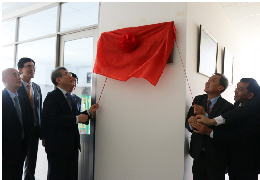
Kéo băng khánh thành Trung tâm Hàn Quốc học tại tầng 6-Nhà Điều hành.

Nhằm góp phần đẩy mạnh giao lưu văn hóa Việt Nam-Hàn Quốc, thúc đẩy việc học tiếng Hàn, thu hút nhiều sinh viên Hàn Quốc, các trường đại học, các công ty Hàn Quốc hợp tác với Trường Đại học Cần Thơ (ĐHCT), Tổng Lãnh sự quán Hàn Quốc tại Thành phố Hồ Chí Minh (TPHCM) đã hỗ trợ Trường ĐHCT thành lập Trung tâm Hàn Quốc học-Trường Đại học Cần Thơ. Bên cạnh đó, Quỹ Sejong Hakdang của Hàn Quốc đã hỗ trợ thành lập Viện Vua Sejong Cần Thơ đặt tại Trường.