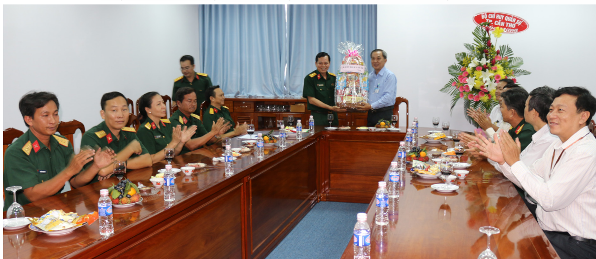
Đoàn công tác Ban Chỉ huy Quân sự thành phố Cần Thơ đến chúc mừng.

Nhân dịp này, lãnh đạo Trường ĐHCT đã gửi lời cảm ơn trân trọng đến sự quan tâm, hỗ trợ và tạo điều kiện thuận lợi của các đơn vị giúp Trường ĐHCT thực hiện tốt vai trò, nhiệm vụ và sứ mệnh của Trường trên tất cả các mặt công tác như giáo dục đào tạo, nghiên cứu khoa học, giáo dục chính trị tư tưởng, đạo đức văn hóa và giữ gìn an ninh trật tự... Những tình cảm ưu ái của các đơn vị dành cho Nhà trường đã và đang tiếp thêm sức mạnh để Trường ĐHCT phấn đấu và đóng góp nhiều hơn nữa cho sự phát triển kinh tế-xã hội của vùng và cả nước.