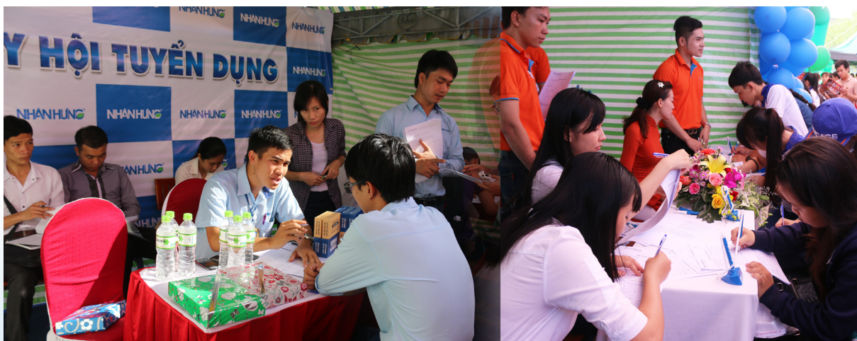
Sinh viên hào hứng tham gia phỏng vấn tại Hội chợ việc làm.