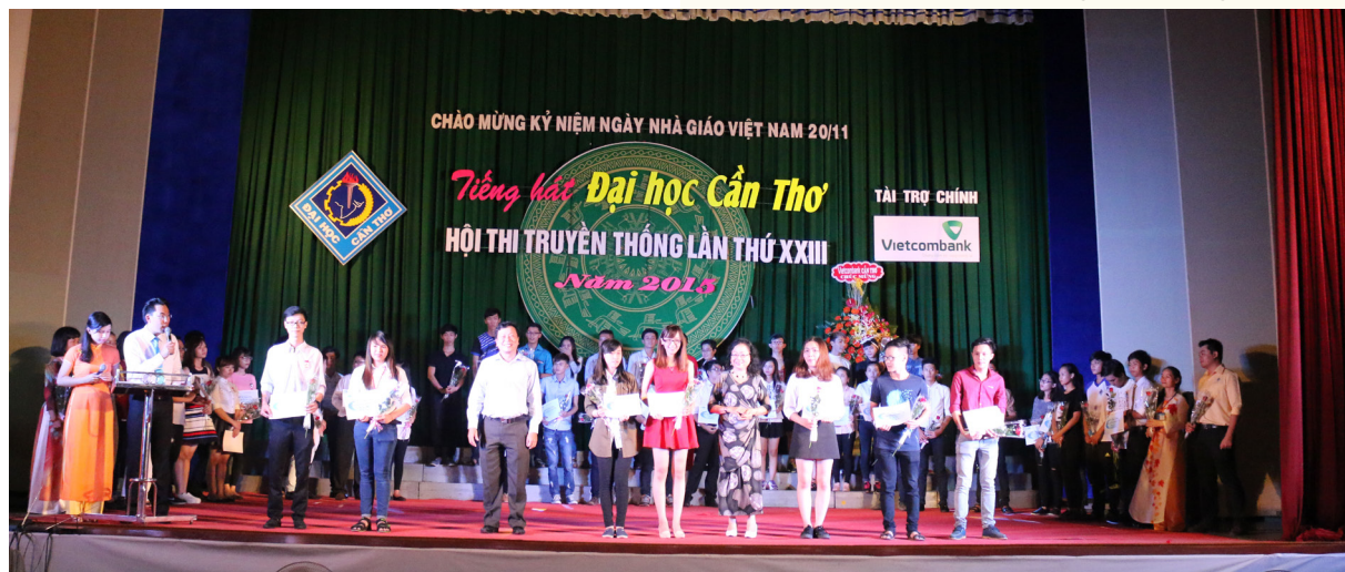
Trao giải thưởng tại đêm Chung kết.

Về kết quả Hội thi, Ban Tổ chức đã trao tổng cộng 72 giải thưởng cho các tập thể, cá nhân dự thi ở các thể loại. Trong sự mong đợi của