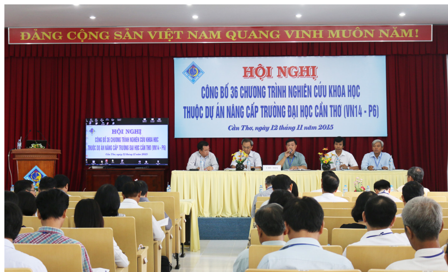
Hội nghị Công bố 36 Chương trình NCKH thuộc Dự án Nâng cấp Trường ĐHCT.

Ngày 12/11/2015, Hội nghị công bố 36 Chương trình Nghiên cứu khoa học (NCKH) thuộc Dự án Nâng cấp Trường Đại học Cần Thơ (ĐHCT) đã diễn ra. Tham dự Hội nghị có các thành viên Ban Giám hiệu; Hội đồng Khoa học và Đào tạo Trường; Ban Điều phối; Ban Quản lý Dự án; đại diện lãnh đạo các khoa, viện, trung tâm, phòng ban chức năng; các nhà nghiên cứu và giảng viên trong Trường.