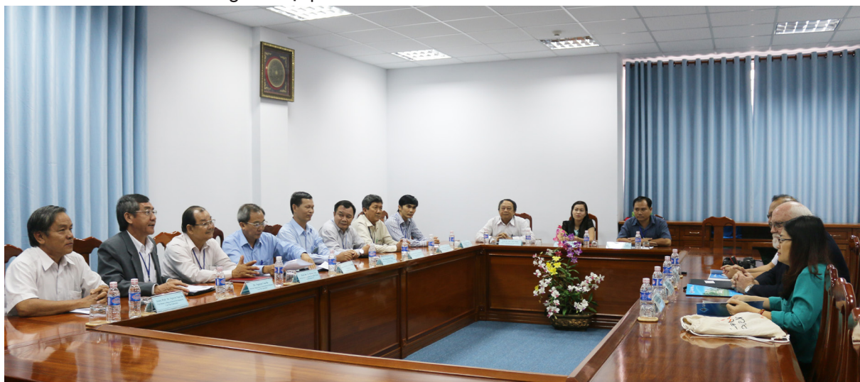
Buổi tiếp đón Tổng Giám đốc IRRI tại Nhà Điều hành Trường ĐHCT.

Qua chuyến thăm này, Tổng Giám đốc IRRI cũng bày tỏ niềm tin tưởng rằng mối quan hệ hợp tác giữa IRRI và Trường ĐHCT nói riêng, với các viện, trường của Việt Nam nói chung sẽ ngày càng phát triển.