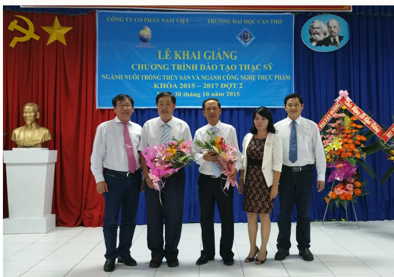
Đại biểu chụp ảnh lưu niệm.

Hiệu trưởng tin tưởng rằng mô hình đào tạo sẽ được nhân rộng nếu triển khai thành công, đáp ứng nhu cầu nguồn nhân lực cho các doanh nghiệp; đồng thời, đóng góp những công trình nghiên cứu có tính ứng dụng cao nhằm thúc đẩy sự phát triển hơn nữa hai lĩnh vực thế mạnh của vùng Đồng bằng sông Cửu Long là Nuôi trồng thủy sản và Công nghệ thực phẩm.