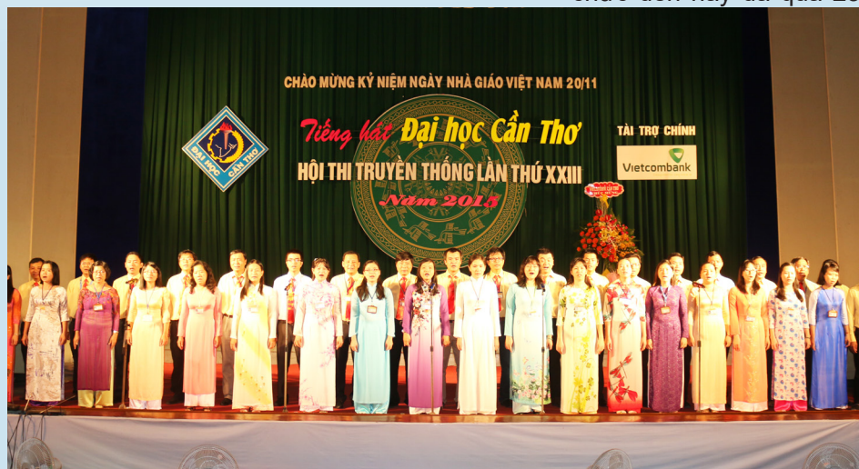
Tiết mục dự thi hát Quốc ca tập thể.

Hội thi Tiếng hát Đại học Cần Thơ có thể loại thi hát tập thể Quốc ca được Nhà trường tổ chức đến nay đã qua 23 lần thi diễn. Quy mô