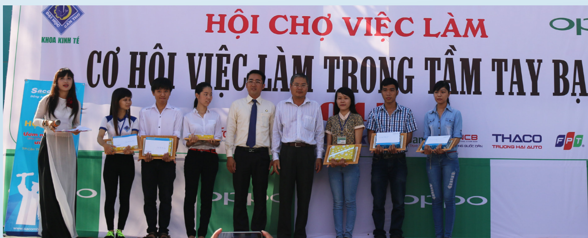
Trao học bổng cho các em có thành tích học tập tốt.