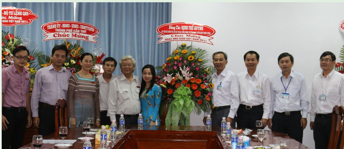
Chụp ảnh lưu niệm với Ban Tuyên giáo Thành ủy thành phố Cần Thơ.

và mối quan hệ đoàn kết gắn bó giữa các đơn vị và Nhà trường. Tại chuyến thăm hỏi, đại diện lãnh đạo các cơ quan đã gửi lời chúc tốt đẹp đến tập thể cán bộ, công chức, viên chức của Trường. Qua đó, bày tỏ niềm tin tưởng vào sự phát triển ngày càng lớn mạnh của Trường ĐHCT-trường đại học trọng điểm của quốc gia tại khu vực Đồng bằng sông Cửu Long.