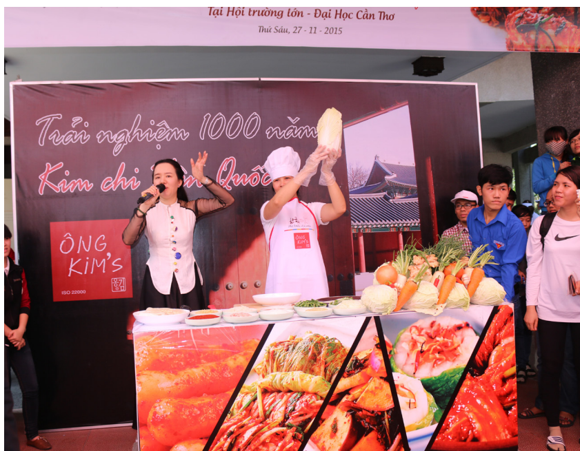
Lễ Hội kim chi được diễn ra tại Hội trường Lớn.

bước ngoặt quan trọng cho mối quan hệ hợp tác đang trên đà phát triển của Trường ĐHCT với các đối tác từ Hàn Quốc.