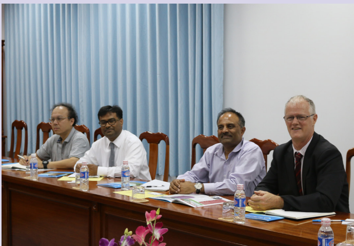
Đại diện đoàn chuyên gia các trường đại học Úc.

Các chuyên gia cũng chia sẻ sau chuyến công tác tại Việt Nam, các báo cáo về chuyến đi thực tế sẽ được trình lên Chính phủ Úc xem xét và đề ra kế hoạch hợp tác tiếp theo.