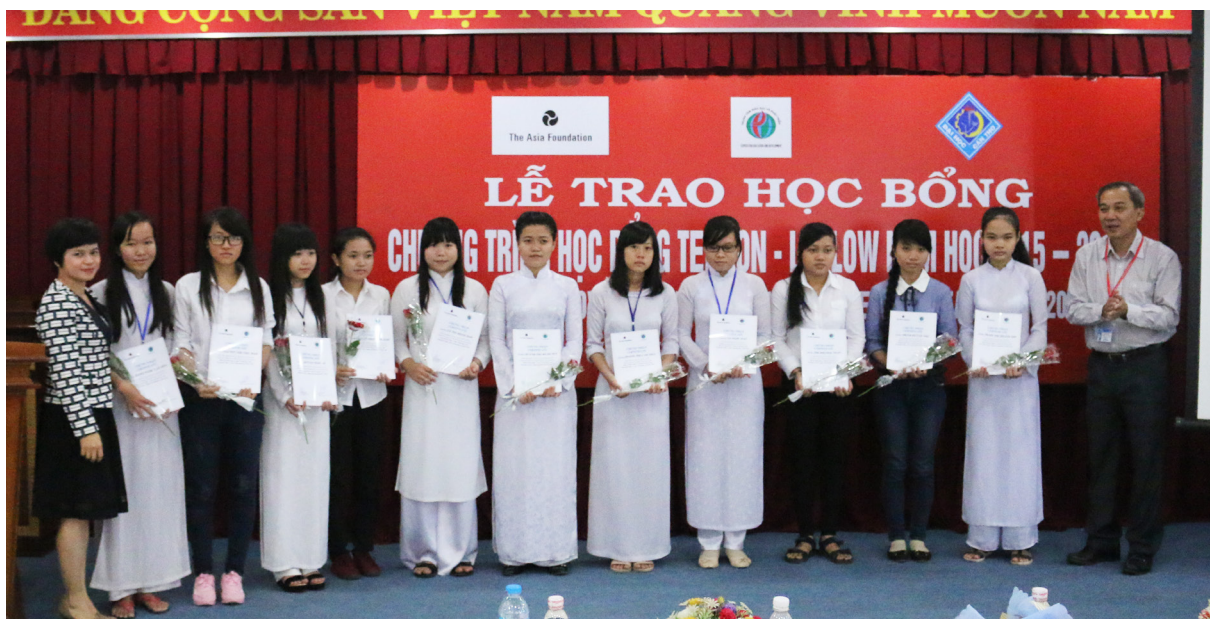
Trao Chứng nhận học bổng cho các nữ sinh viên.

Ngày 26/11/2015, Trung tâm Giáo dục và Phát triển kết hợp với Trường Đại học Cần Thơ (ĐHCT) tổ chức Lễ Trao Học bổng Teillon-Ludlow cho nữ sinh viên Trường ĐHCĐ năm học 2015-2016 tại Nhà Điều hành của Trường.