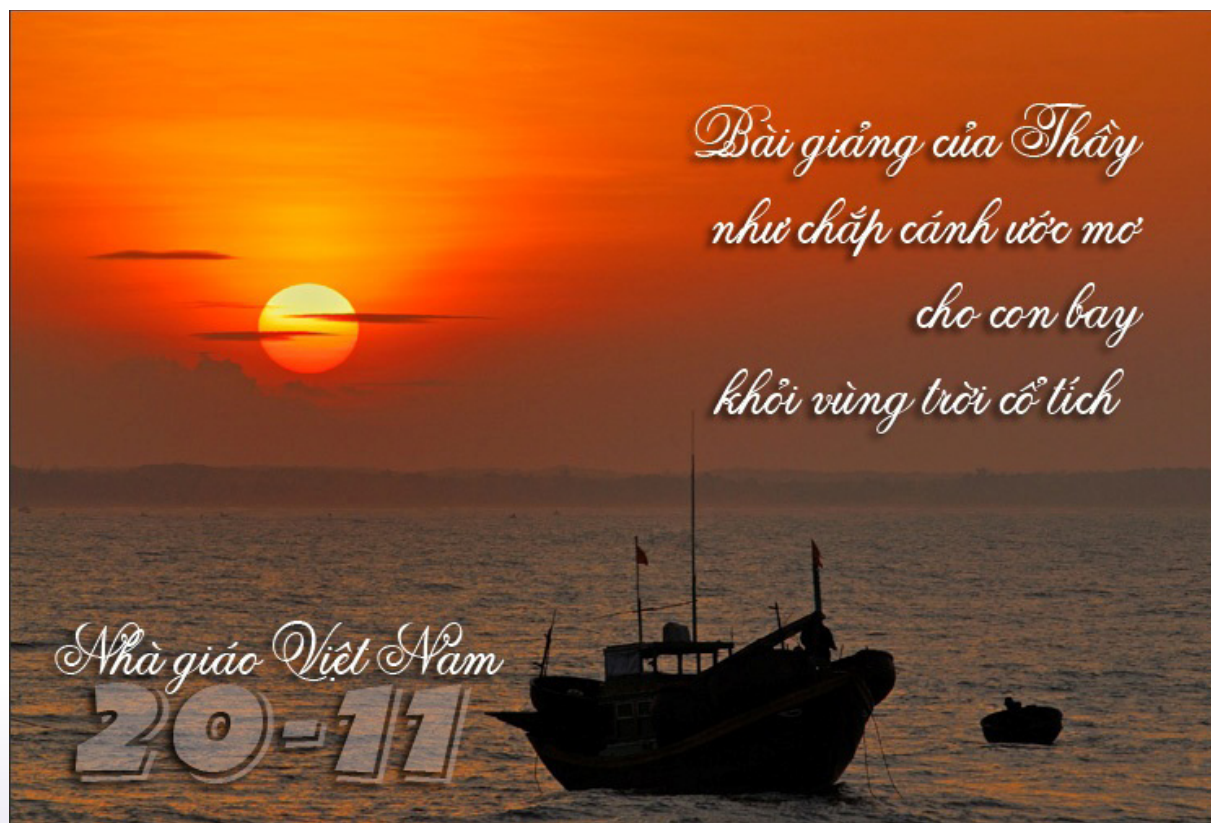
Ảnh minh họa.

Và quý thầy cô ơi, trong lòng những đứa học trò chúng em, thì ngày nào cũng là ngày 20/11!