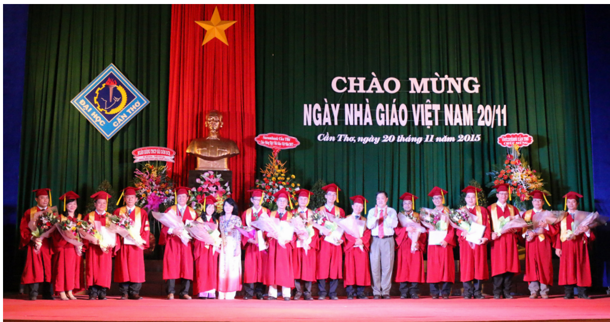
Tôn vinh 17 nhà giáo đạt chuẩn chức danh Phó Giáo sư năm 2015.