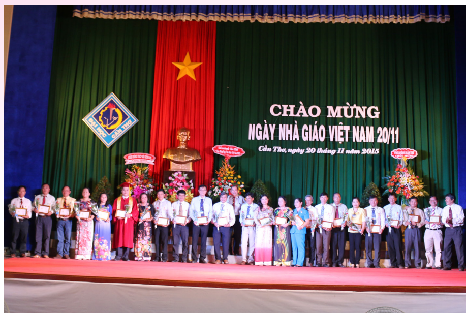
Trao tặng Kỷ niệm chương "Vì sự nghiệp giáo dục" cho 26 cán bộ, thầy cô giáo của Trường đã có nhiều đóng góp cho sự nghiệp giáo dục và đào tạo của đất nước.

đã quyết định tôn vinh 31 giảng viên, viên chức và người lao động có nhiều đóng góp cho sự phát triển Nhà trường nhân dịp Kỷ niệm ngày Nhà giáo Việt Nam. Bên cạnh đó, Công đoàn Trường ĐHCT đã xét tôn vinh 20 thầy cô, viên chức là những tấm gương tiêu biểu trong công tác vì sự tiến bộ phụ nữ giai đoạn 2010-2015.