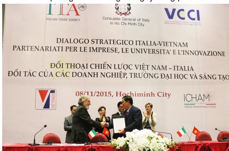
Đại diện lãnh đạo Trường ĐHCT và Trường Đại học Modena và Reggio Emilia ký kết Bản Ghi nhớ hợp tác.

Nhân dịp này, Trường ĐHCT đã ký kết Bản Ghi nhớ hợp tác với Trường Đại học Modena và Reggio Emilia với mục tiêu thúc đẩy mối quan hệ hợp tác trong các lĩnh vực trao đổi cán bộ giảng dạy, nghiên cứu, và kỹ thuật; trao đổi sinh viên; trao đổi các tài liệu, ấn phẩm khoa học; tổ chức các hội nghị, hội thảo khoa học... Hiệu trưởng cũng bày tỏ lời cảm ơn sâu sắc đến bà Cecilia Piccioni, Đại sứ Italia tại Việt Nam đã tạo nhiều cơ hội hợp tác giữa Trường ĐHCT với các trường đại học của Italia và tin tưởng rằng mối quan hệ tốt đẹp giữa Trường ĐHCT với các trường đại học của Italia nói riêng và giữa hai quốc gia nói chung sẽ ngày càng phát triển.