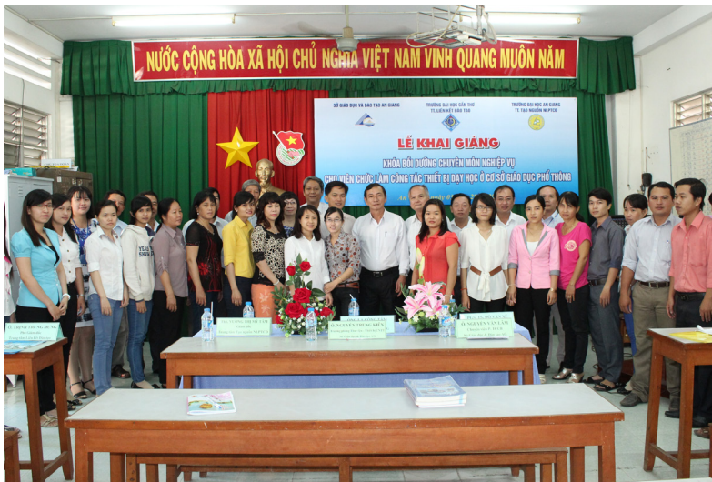
Đại biểu và học viên chụp ảnh lưu niệm.

Trong thời gian tới, Trường ĐHCT sẽ tiếp tục phối hợp với Trường Đại học An Giang và Sở GD&ĐT tỉnh An Giang tổ chức các lớp bồi dưỡng, tập huấn ngắn hạn về chuyên môn nghiệp vụ nhằm nâng cao năng lực quản lý và giảng dạy cho cán bộ và giáo viên trên địa bàn tỉnh.